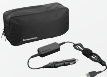
Lenovo® 65 W DC-Reisenetzteil (0B47481)