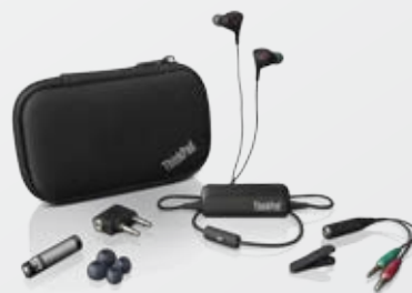
ThinkPad Ohrhörer mit Geräuschunterdrückung (0B47313)