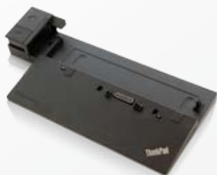
2013 ThinkPad® Docking: ThinkPad® Ultra Dock (40A20090XX), ThinkPad® Pro Dock (40A10065XX), ThinkPad® Dock (40A00065)