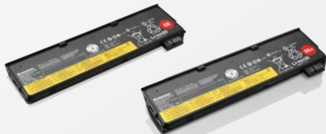
ThinkPad 68/68+ Akku ThinkPad 68 (3 Zellen) – Best.-Nr. 0C52861